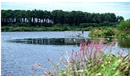
Le Lac Moïsan

Accès facile à l'océan (1500 m) par la route, la piste cyclable séparée de la route ou les sentiers forestiers bordant le lac Moïsan (500 m). Le quartier est celui de Messanges le plus proche de la mer. Baignade surveillée en juillet et août.